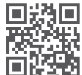
QR - Code zur Website