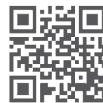
QR - Code zum KLHdesigner