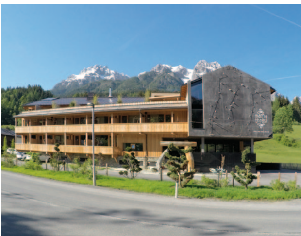
Christian Schöch / Hotel mama thresl