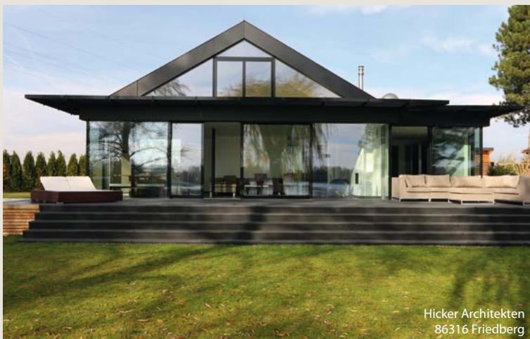
Hicker Architekten 86316 Friedberg