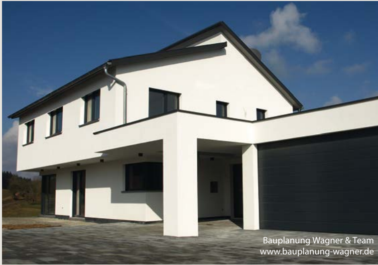
Bauplanung Wagner & Team www.bauplanung-wagner.de