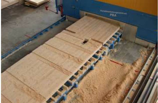
Bis zu 16 m lange Bauteile können bei Biber Holzbearbeitung mit der PBA bearbeitet werden