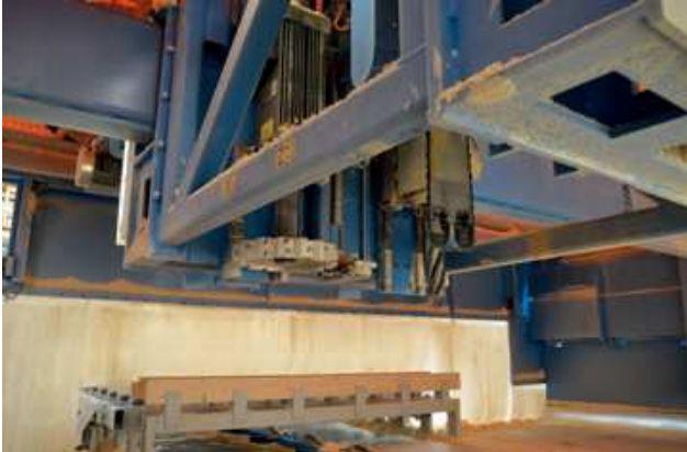
Umfangreiche Ausstattung: Die PBA verfügt über ein fünfachsiges CNC-Aggregat mit Werkzeugwechsler