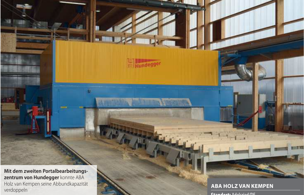
Mit dem zweiten Portalbearbeitungs-zentrum von Hundegger konnte ABA Holz van Kempen seine Abbundkapazität verdoppeln