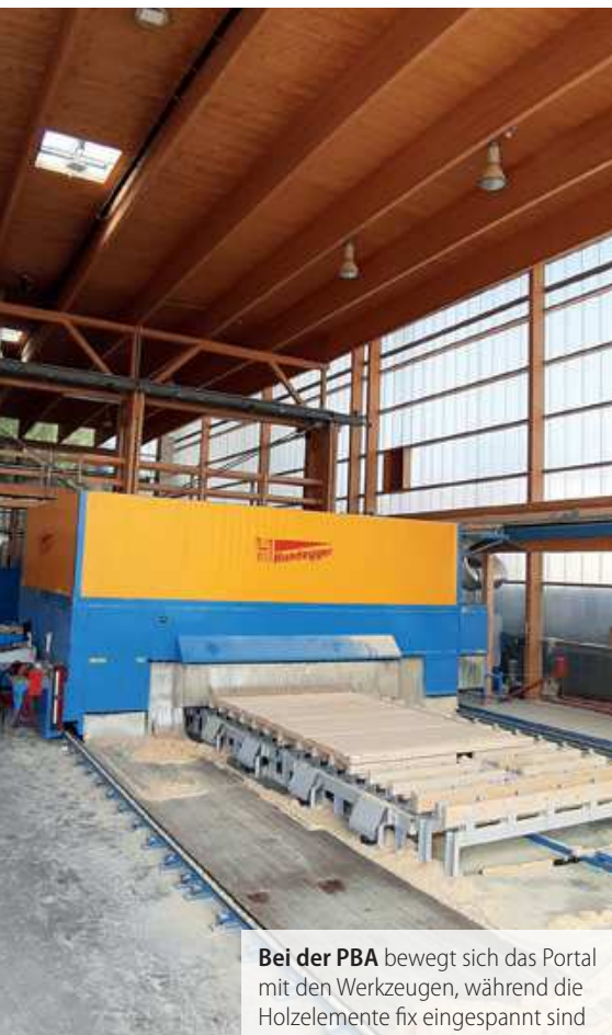
Bei der PBA bewegt sich das Portal mit den Werkzeugen, während die Holzelemente fix eingespannt sind

Dass bei Biber zwei Anlagen desselben Herstellers im Einsatz sind, hat mehrere Vorteile. „Wir müssen bei der Arbeitsvorbereitung nicht darauf achten, auf welcher Maschine das jeweilige Element bearbeitet werden muss. Das entscheiden die Mitarbeiter bei Biber vor Ort, auf welcher PBA der Abbund erfolgt“, erläutert van Kempen, da die Biber-Mannschaft bereits ausreichend Erfahrung mit den Hundegger-Anlagen hat. Die Einschulung verlief